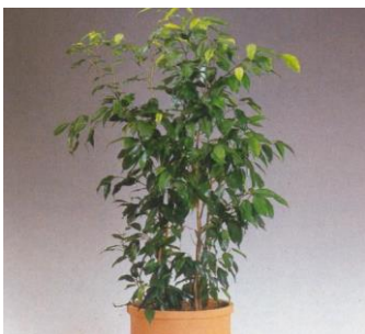
Ficus beniamina 07