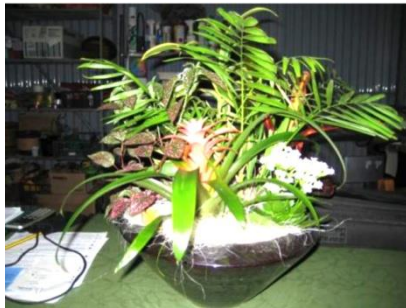
Composizione G. 18-1