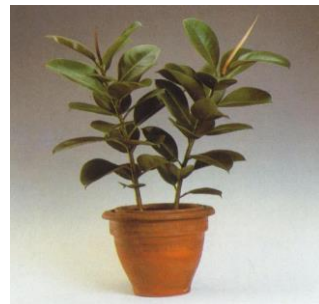
Ficus elastica 08