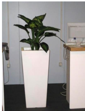
Vaso alto e pianta 19