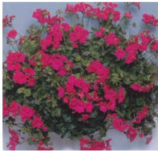
Geranio parigino 16