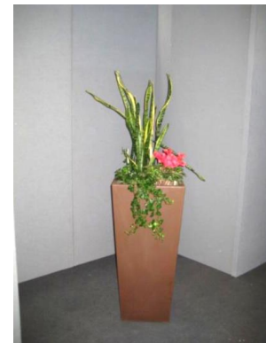
Comp. vaso alto 20