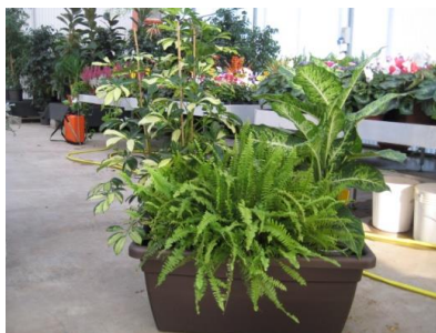
Comp. piante in vasc 21